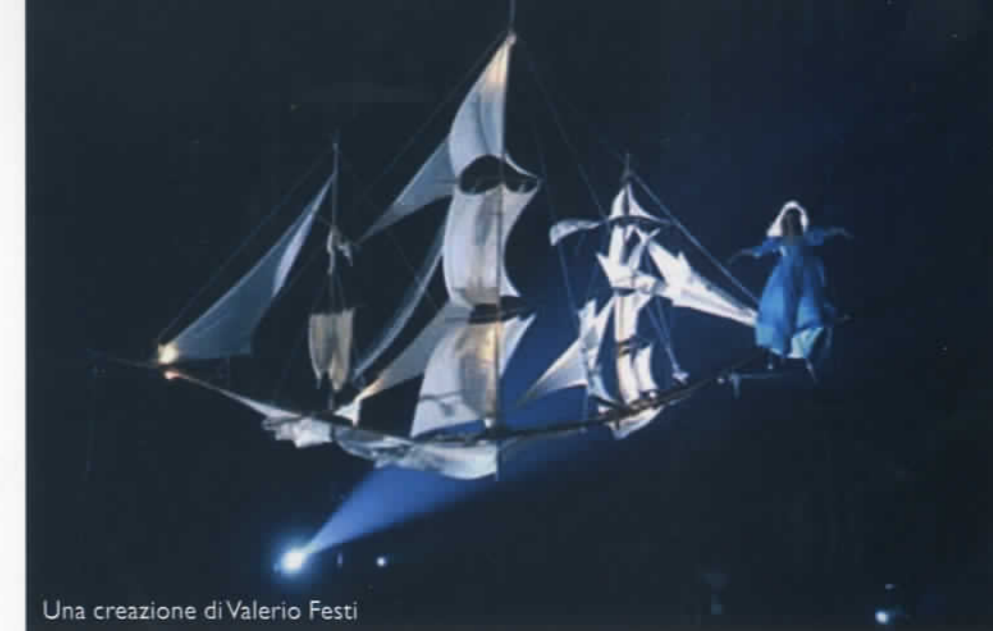
Una creazione di Valerio Festi

Nei passi in cui il fantastico s'affaccia, e che nessun orchestratore ottocentesco poteva attuare integralmente, Ravel apre orizzonti fonici inimmaginabili. Almeno un esempio: i sinistri cachinni di Gnomus , esposti la prima volta dai legni, vengono poi portati a un aggricciante p con l'intervento della celesta, su glissando degli archi e armonici d'arpa. La scrittura orchestrale consente il tempo